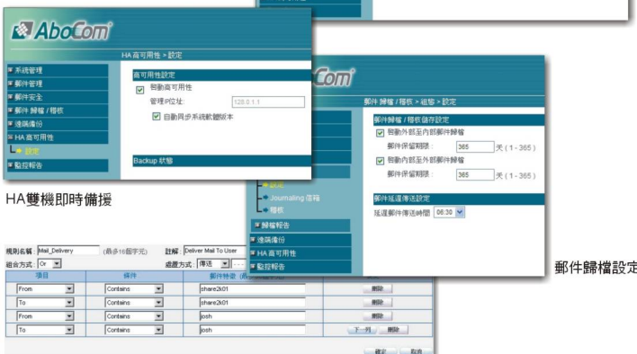
郵件稽核 Mail Auditing